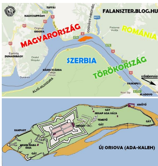
Ada-Kaleh szigete 2

Készítsétek el egy utazási iroda reklámfilmjét, amelyben a Senki szigetére szervezett utazás hirdetése szerepel!